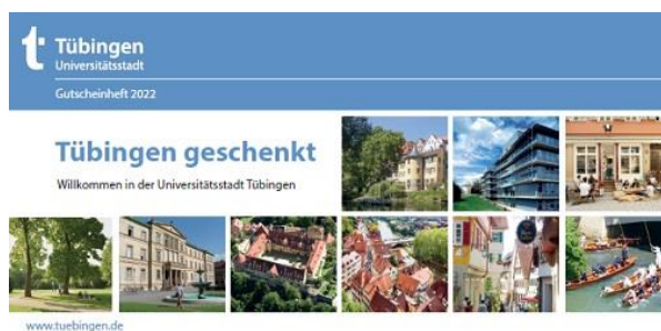
Cover Gutscheineft: WIT