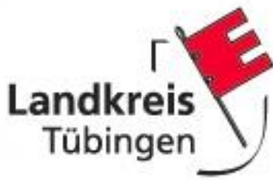
Logo: Landkreis Tübingen