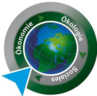
Grafik: Wikipedia/ Kitaki test2

https://www.reutlingen.ihk.de/aktuelles/meldung/institut-fuer-nachhaltiges-wirtschaften-startet/