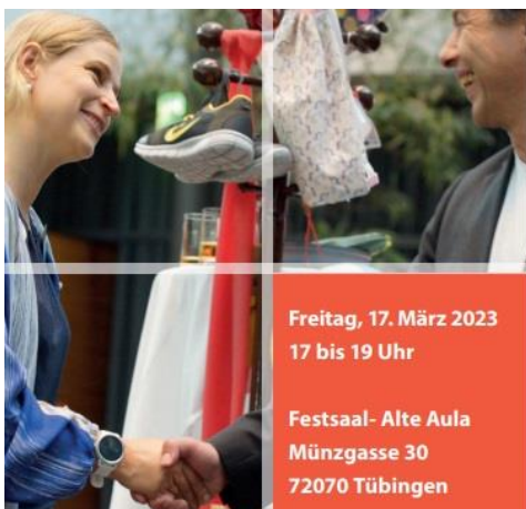
Grafik: Universitätsstadt Tübingen

https://worldcitizen.school/event/marktplatz-fuer-gute-geschaefte/