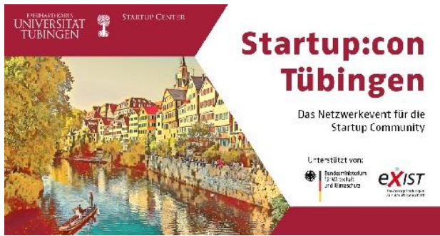
Grafik: Universität Tübingen